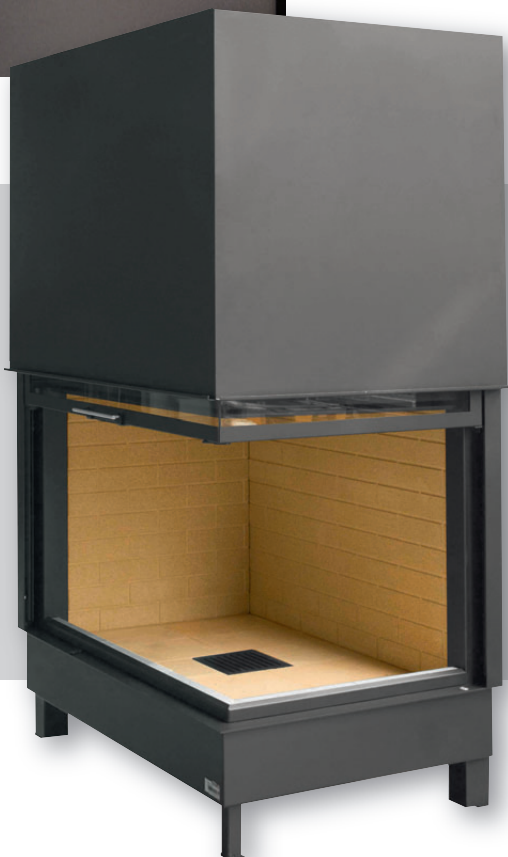
THERMAX®-Platten werden präzise produziert – für eine exakte Verarbeitung

Die Marktentwicklung der letzten Jahre zeigt, dass THERMAX®-Feuerraumauskleidungen eine hochwertige und sichere Alternative darstellen. Qualität + Innovation setzen sich durch.